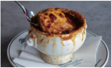
オニオングラタンスープ French onion soup gratinée 780 (858)