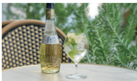
サンジェルマンズスプリッツァー 680(748) エルダーフラワー+スパークリングワイン+ソーダ St-Germain Spritzer