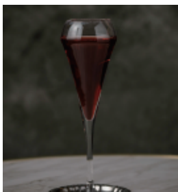
キールロワイヤル Kir Royale スパークリングワイン+カシスリキュール 680 (748)