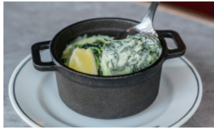
ほうれん草のクリーム煮 Spinach in cream sauce 680 (748)