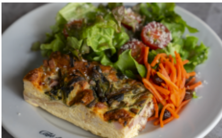
季節のキッシュプレート Seasonal quiche plate 980 (1078)