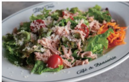
モルタデッラとチーズのサラダ Mortadella & cheese salad plate 980 (1078)