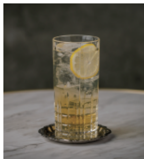
パナシェ ビール+レモネード Panaché