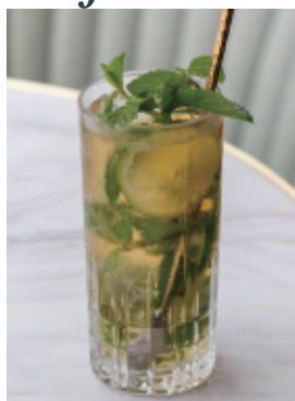
スタンダードモヒート Standard mojito 700 (770)