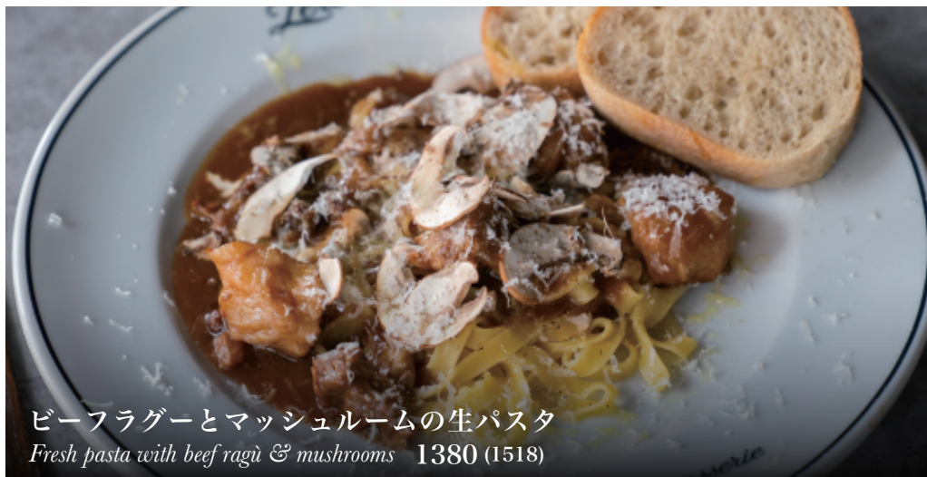
ビーフラグーとマッシュルームの生パスタ Fresh pasta with beef ragu & mushrooms 1380 (1518)

五感で味わう、ゼロワンカフェの生パスタ体験。 Experience fresh pasta with all five senses — only at Zero One Café.