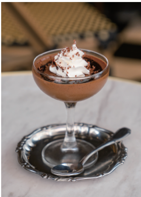
チョコレートのムース Chocolate mousse 680 (748)