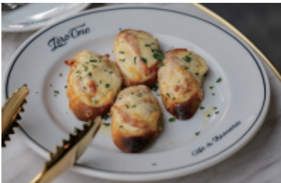
ハムとチーズのタルティーヌ 880 (968) Ham and cheese tartine