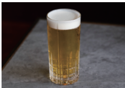
サッポロ生ビール Sapporo draft beer 680 (748)