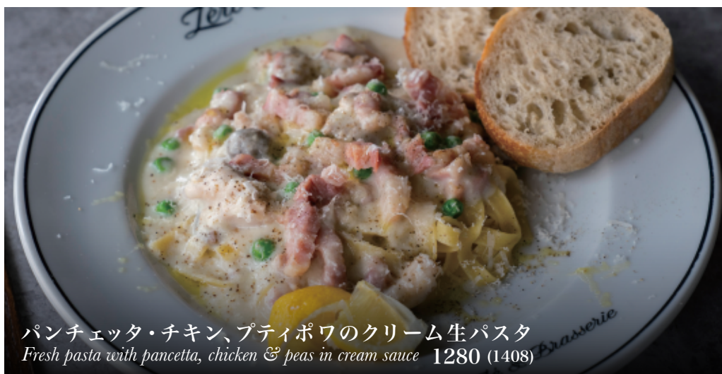
パンチェッタ・チキン、プチポワのクリーム生パスタ Fresh pasta with pancetta, chicken & peas in cream sauce 1280 (1408)