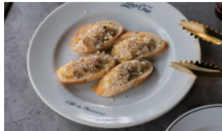
蜂蜜とカマンベールのタルティーヌ 780 (858) Honey and camembert tartine