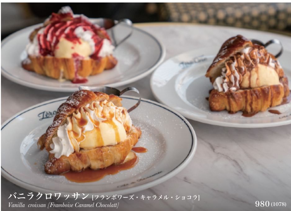
バニラクロワッサン [フランボワーズ・キャラメル・シヨコラ] Vanilla croissant [Framboise Caramel Chocolatt]