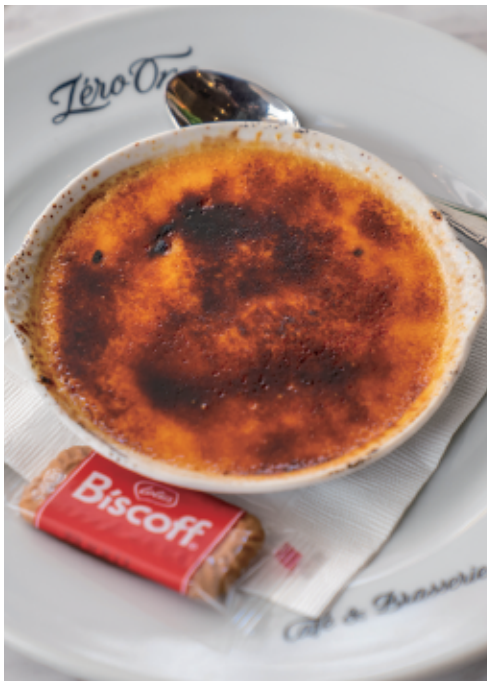
クラシックフレンチクリームブリュレ Classic French Crème Brûlée 1080 (1188)