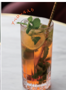
ヴィネツィアモヒート Venezia mojito モヒート+アペロール 700 (770)