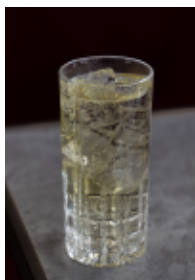
ハイボール 水割り・ロックなどもあり Highball 580 (638)