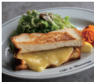
ハムとチーズのサンドイッチ サラダ付き Ham and cheese sandwich 1280 (1408)