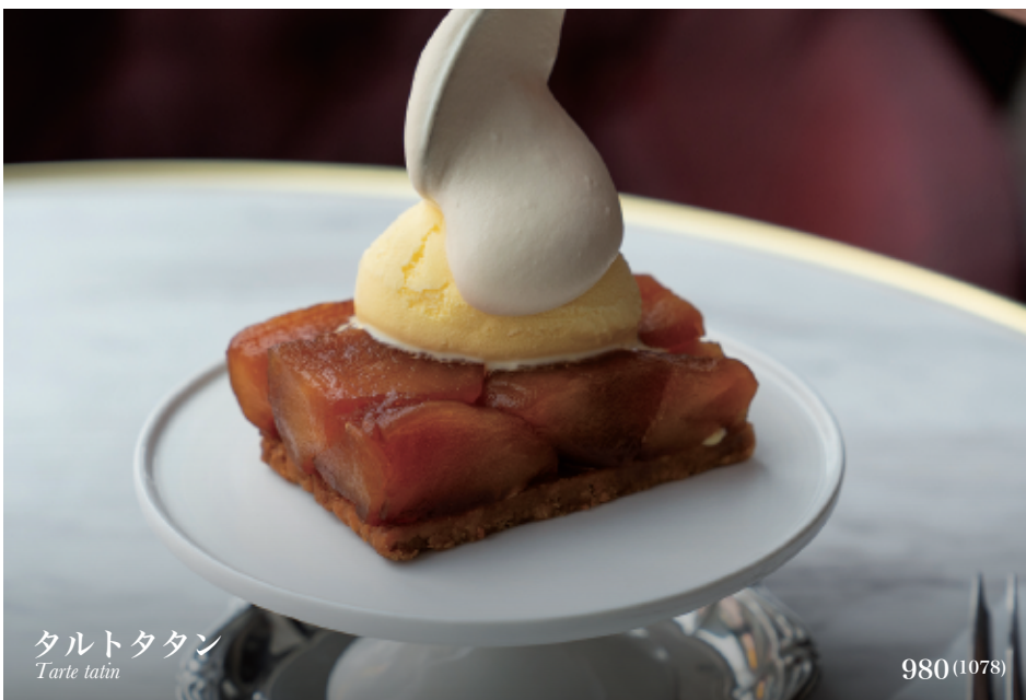
タルトタタン Tarte tatin

とろける自家製の贅沢。濃厚デザートで特別なひとときを Homemade bliss. Indulge in rich, melting desserts.