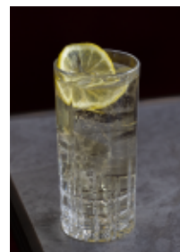
ジンジャー ハイボール Ginger highball 630 (693)