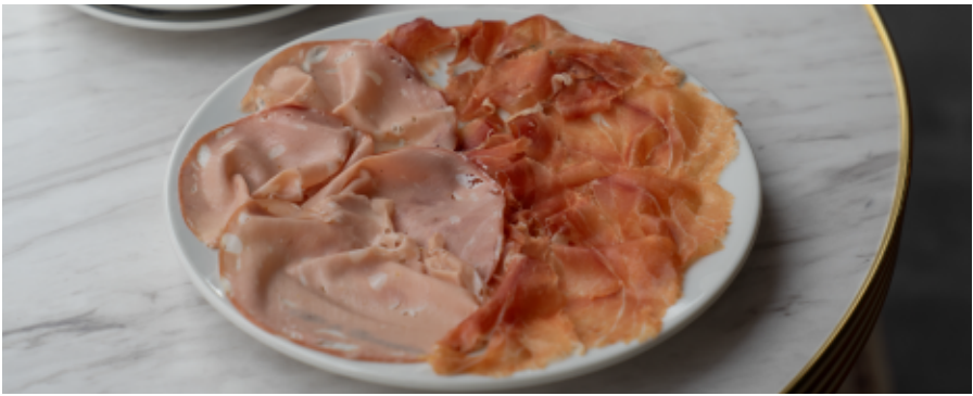
擦りたて熟成生ハムプロシュートとモルタデッラ Freshly shaved aged prosciutto and mortadella

芳醇なトリュフと濃厚チーズが香る、 贅沢に仕立てた山盛りのフレンチフライドポテト。