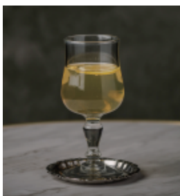
オペレーター Operator 白ワイン+ジンジャーエール 630 (693)