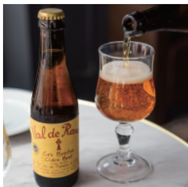
林檎のスパークリングワイン シードル ヴァル+ド+ランス クリュブルトン Cidre Val de Rance Cru Breton apple sparkling wine 980 (1078)