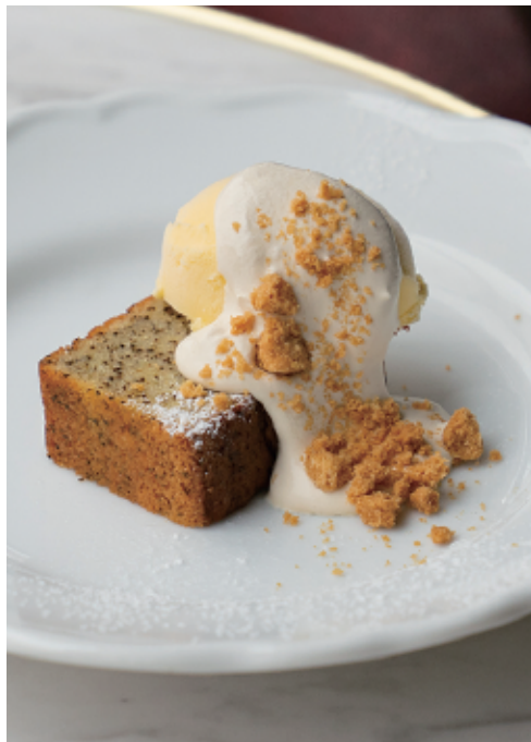
アールグレイパウンドケーキ Earl grey pound cake with vanilla ice cream and lemon confiture 780 (858)