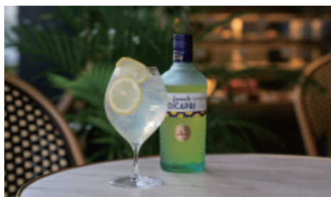
リモンチェッロスプリッツァー 680(748) リモンチェッロ+スパークリングワイン+ソーダ Limoncello Spritzer