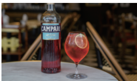
カンパリスプリッツァー 680(748) カンパリ+スパークリングワイン+ソーダ Campari Spritzer