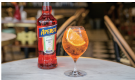
アペロールスプリッツァー 680(748) アペロール+スパークリングワイン+ソーダ Aperol Spritzer