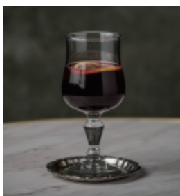
キティ Kitty 赤ワイン+ジンジャーエール 630 (693)