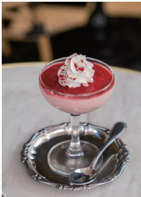
フランボワーズのムース Framboise mousse 680 (748)