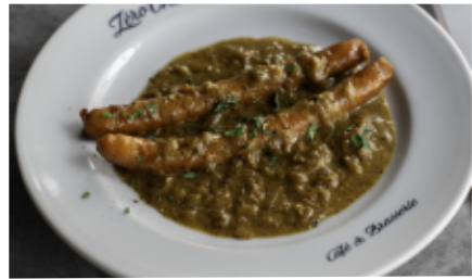
グリルドソーセージ オニオンマスタードソース Grilled sausage with onion mustard sauce 980 (968)