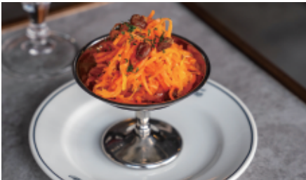
にんじんとクミン、レーズンのラペ Carrot, cumin, and raisin slaw 580 (638)