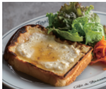
蜂蜜とカマンベールの オープンサンド サラダ付き Honey and camembert open sandwich 1180 (1298)