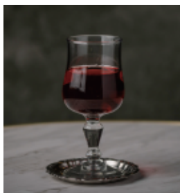
キール Kir 白ワイン+カシスリキュール 650 (715)