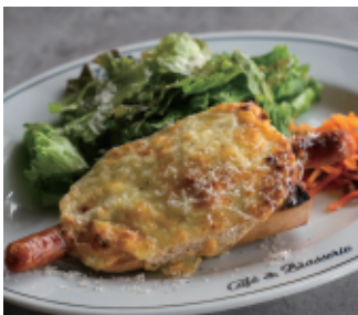
パリジャンホットドッグ サラダ付き Parisian hot dog 1280 (1408)