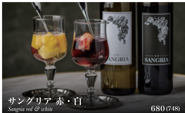
サングリア 赤・白 Sangria red & white